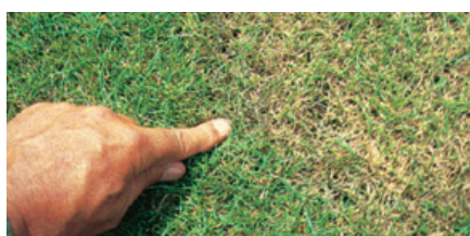
Rizoctonia - Brown patch