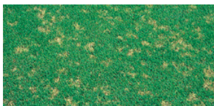
Sclerotinia - Dollar spot